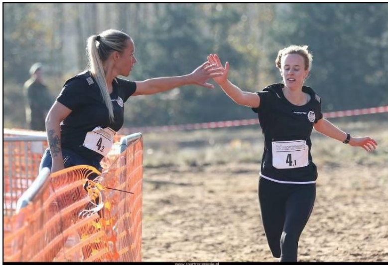
"de wissel d.m.v. hand aantikken"