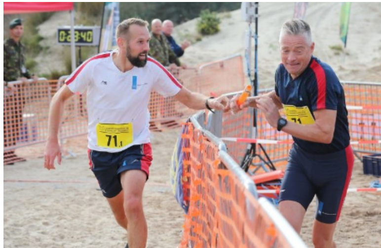
"de wissel d.m.v. overdragen van de baton"