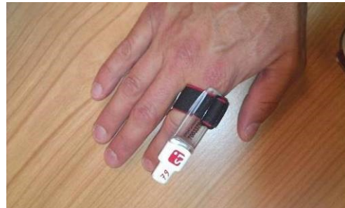
Fig. 2 & 3