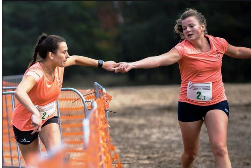
"de wissel d.m.v. hand aantikken"